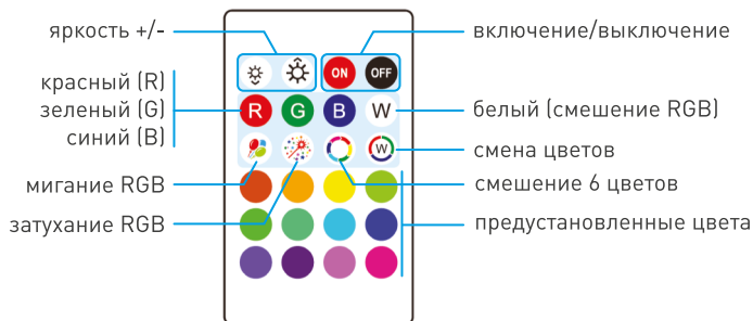
Рисунок 2. Назначение кнопок на пульте SMART-MINI-RGB-SET