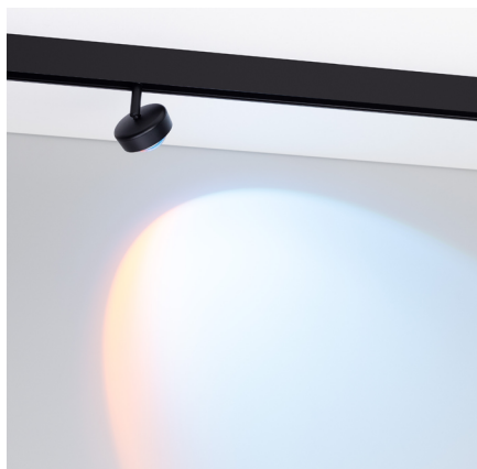
Светофильтр Red Blue