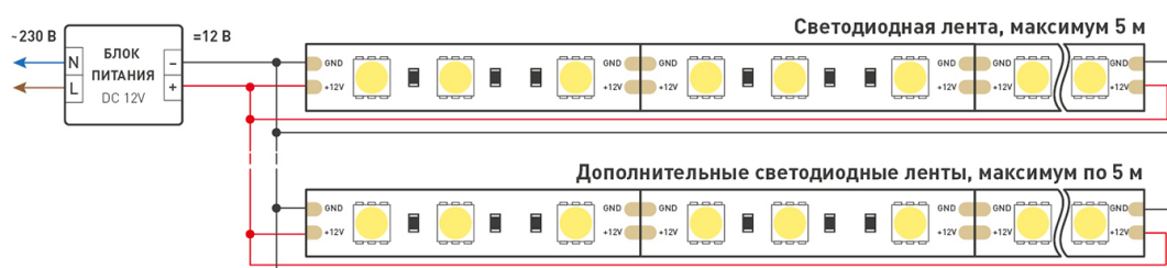
Схема 2. Подключение нескольких светодиодных лент с двух сторон.

Рекомендуется использовать для обеспечения равномерного свечения ленты по всей длине.